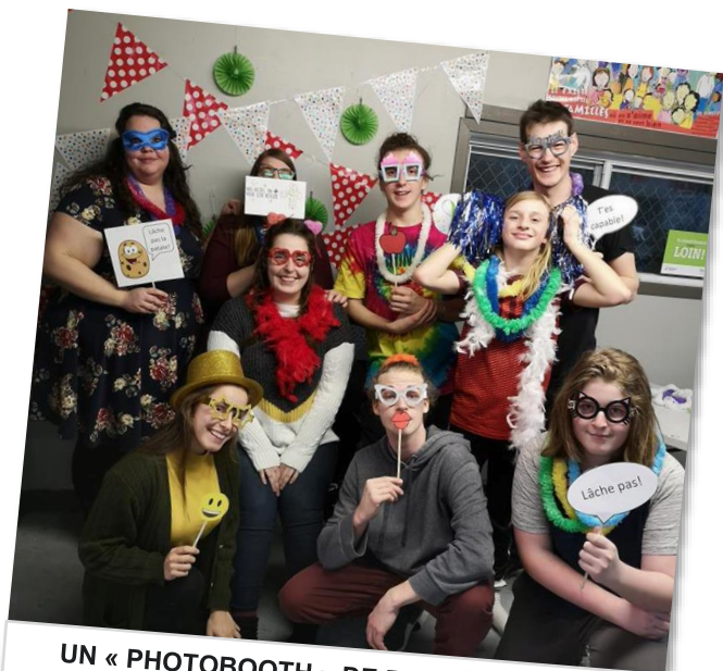
UN « PHOTOBOOTH » DE PERSÉVÉRANTS! (Maison des jeunes de Saint-Georges-de-Champlain)