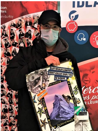
TABLEAUX DE VISUALISATION (Formation générale des adultes du Chemin-du-Roy)