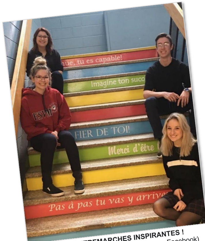
DES CONTREMARCHES INSPIRANTES ! (École secondaire Val-Mauricie)