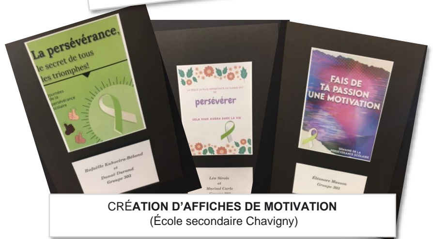
CRÉATION D'AFFICHES DE MOTIVATION (École secondaire Chavigny)