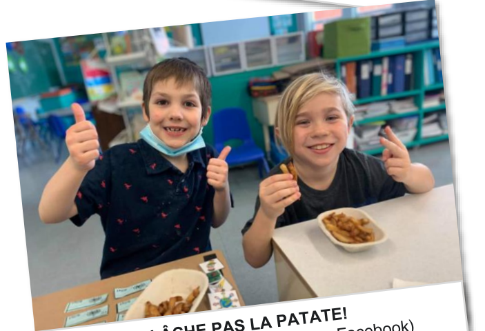
LÂCHE PAS LA PATATE! (École primaire St-Paul – Source Facebook)