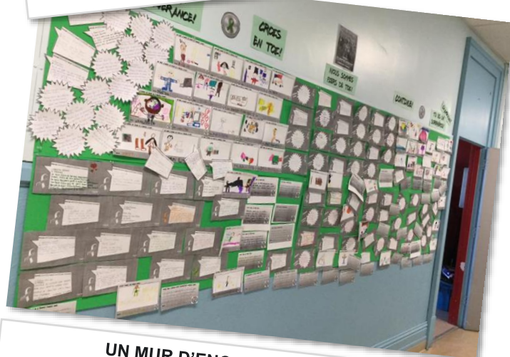
UN MUR D'ENCOURAGEMENTS (École primaire Saint-Paul)