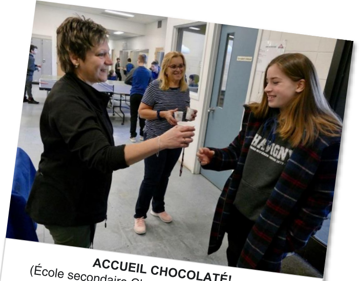
ACCUEIL CHOCOLATÉ! (École secondaire Chavigny – Source Facebook)