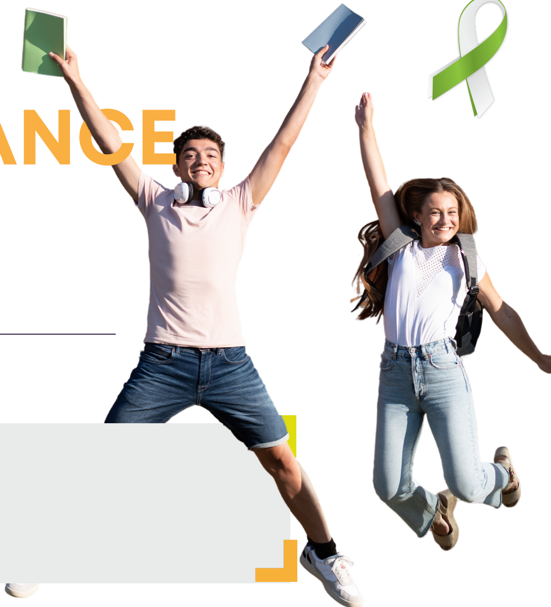
TABLE RÉGIONALE DE L'ÉDUCATION DE LA MAURICIE