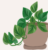
Une plante verte