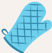
Une mitaine de four