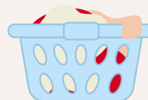
Un panier à linge