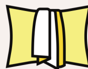
Une taie d'oreiller