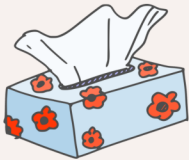
Une boîte de mouchoirs