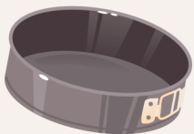
Un moule à gâteau