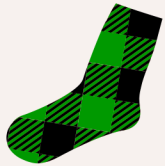
Un bas de laine

Connais-tu bien ta maison? Amuse-toi à trouver tous ces éléments! Encerle ce que tu trouves!