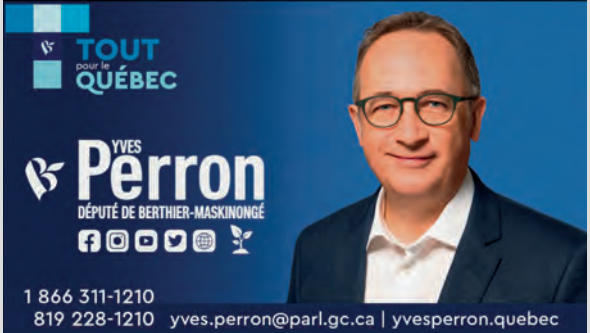
YVES Perron DÉPUTÉ DE BERTHIER-MASKINONGÉ

1634, rue Notre-Dame Centre, Niv. 1 Local 3, Trois-Rivières, Qc G9A 6E5