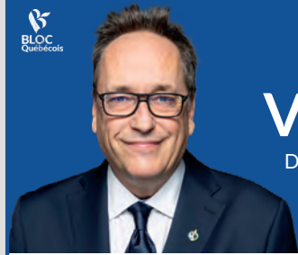
René Villemure Député de Trois-Rivières