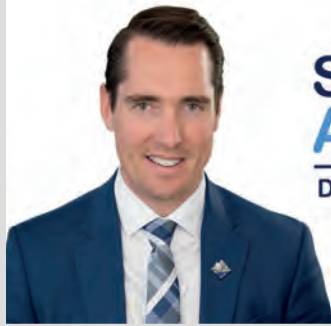
Simon ALLAIRE Député de Maskinongé