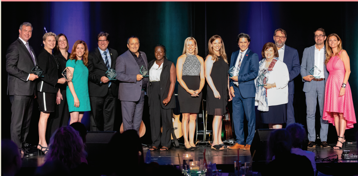
Sur cette photo sont présents certains membres de l'équipe et du conseil d'administration de la TREM.

Chacun des membres du conseil d'administration contribue à l'avancement de la mission de l'organisation en y apportant ses connaissances et son expertise.